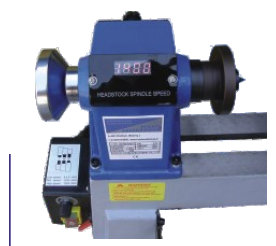
Antriebseinheit mit Handrad