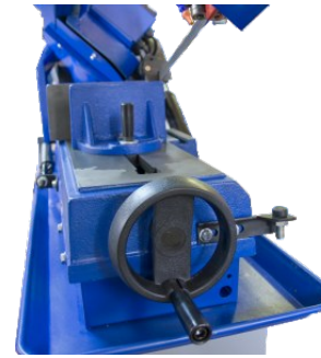
Rad für Schnellspannschraubstock